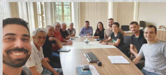
Apresentação do Selo para a Pró Reitoria de Administração - PAD UFV

O calendário para apresentação do Selo já está aberto para as unidades vinculadas a estes setores.