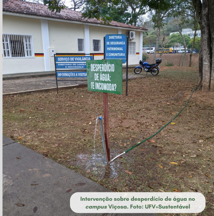
Intervenção sobre desperdício de água no campus Viçosa.

Em atendimento ao Decreto 5.440/2005, a Divisão de Água e Esgoto (DAG-UFV) informa a qualidade da água tratada na ETA-UFV e distribuída no campus UFV-Viçosa.