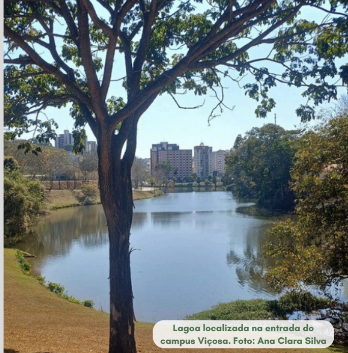
Lagoa localizada na entrada do campus Viçosa.

Em atendimento ao Decreto 5.440/2005, a Divisão de Água e Esgoto (DAG-UFV) informa a qualidade da água tratada na ETA-UFV e distribuída no campus UFV-Viçosa.