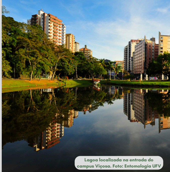
Lagoa localizada na entrada do campus Viçosa.

Em atendimento ao Decreto 5.440/2005, a Divisão de Água e Esgoto (DAG-UFV) informa a qualidade da água tratada na ETA-UFV e distribuída no campus UFV-Viçosa.